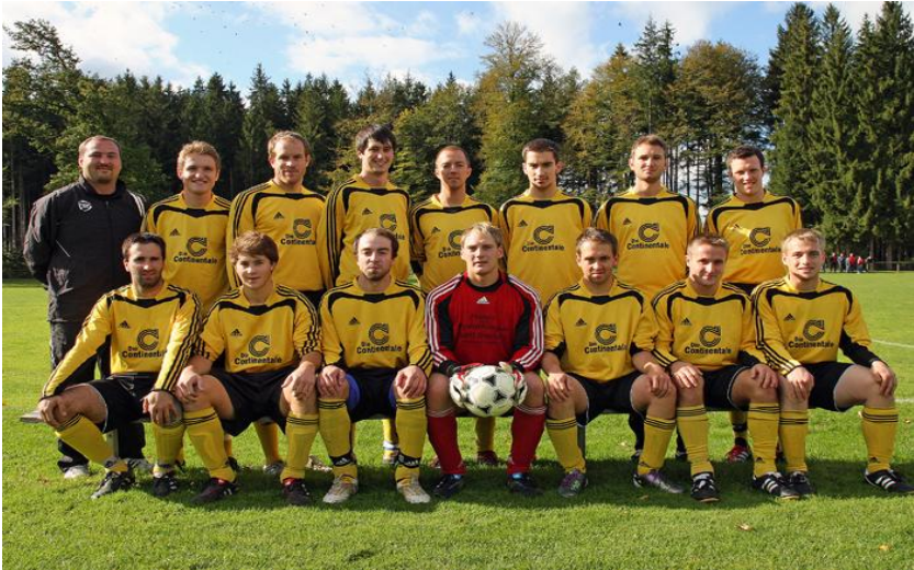
Die erste Mannschaft im Oktober 2011